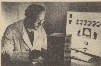
Wissenschaftlich bewiesen: Die Aufbaustoffe von Neo-Silvikrin gelangen bis in die Haarwurzeln!

Bestimmt haben auch Sie schon dies oder jenes unternommen, um den Haarausfall aufzuhalten ... und das Ergebnis??? Jetzt endlich brauchen Sie nicht mehr den Mut zu verlieren, denn es gibt ja Neo-Silvikrin — die auf der ganzen Welt anerkannte biologische Haarnahrung! Die erste Voraussetzung für die Wirksamkeit eines Haarpräparates ist: Seine Wirkstoffe müssen bis in die Haarwurzeln gelangen!