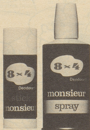
Stick monsieur Fr. 3.60