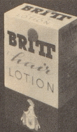
BRITT hair Lotion