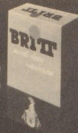
BRITT nach dem Rasieren