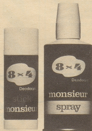
Stick monsieur Fr. 3.60