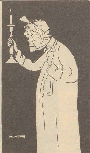
Adele Sandrock