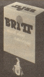
BRITT nach dem Rasieren