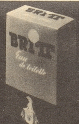
BRITT Eau de Toilette 80°

BRITT hair Lotion und BRITT hair Cream verhindern Schuppen und Haarausfall, schenken dem Haar einen natürlichen, anziehenden Glanz, erlauben ein leichtes Frisieren und machen die Frisur lange haltbar. BRITT bietet alles, was man von modernen Haarpflegemitteln erwarten kann.