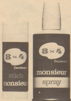
Stick monsieur Fr. 3.60 Spray monsieur Fr. 6.60