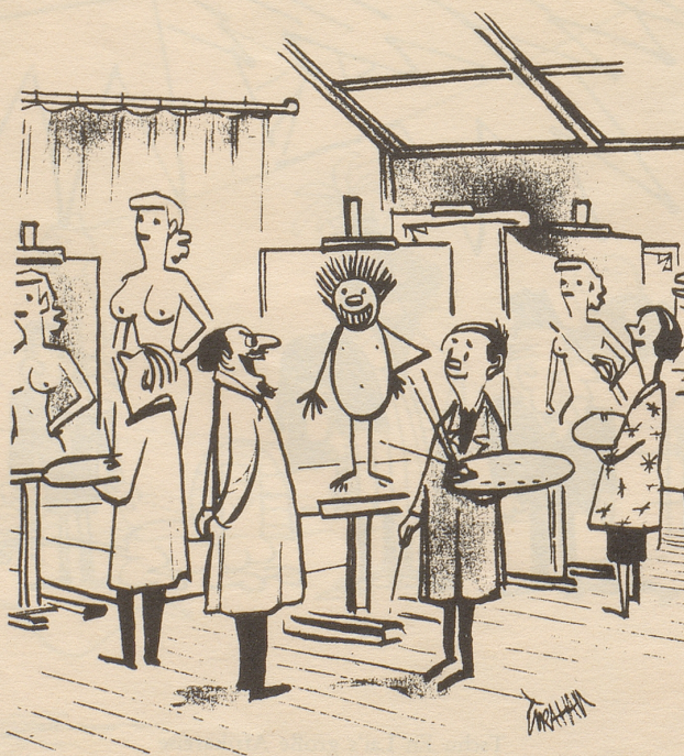
«Sie sind zum erstenmal hier, nicht wahr?»

Das Organ der jurassischen Unabhängigkeitsbewegung findet den Gedanken de Gaulles grandios, nach welchem Westschweizer, Wallonen und Kanadier in Paris, Deutschschweizer in Bonn und Tessiner im