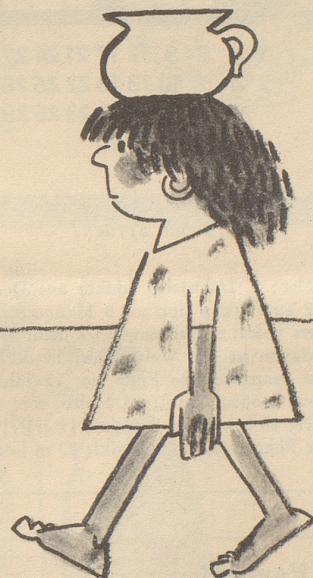
Die Alten und die Jungen