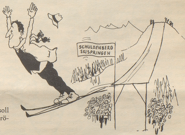
Skispringen: Die Regierung soll dem Volk erlauben, immer größere Sprünge zu machen.

Mit knappem Mehr hat das Walliser Volk der Regierung einen Kredit zur Durchführung der Olympischen Winterspiele 1968 in Sitten verweigert. Die Stadtväter von Sitten hoffen indessen, bei der Anmeldung für 1972 mehr Glück zu haben. Dazu bedarf es aber einer konsequenten Erziehung der Stimmbürger! Unser Zeichner Hans Moser unternahm es in verdankenswerter Weise, für die Walliser Volkstrainer ein Programm aufzustellen, das überdies den Vorteil hat, sich in den wichtigsten Punkten an die Wettbewerbskategorien der Olympischen Winterspiele anzulehnen.