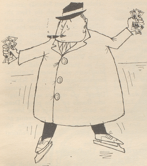
Eislauf: Das Walliser Volk soll sich vermehrt bemühen, die Bodenspekulanten aufs Eis zu legen.