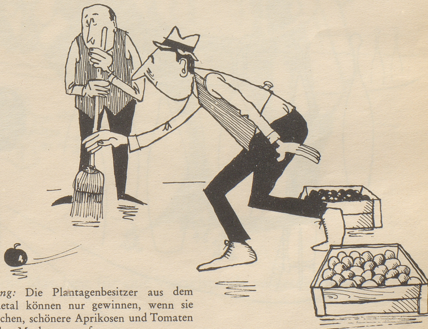
Curling: Die Plantagenbesitzer aus dem Rhonetal können nur gewinnen, wenn sie versuchen, schönere Aprikosen und Tomaten auf den Markt zu werfen.