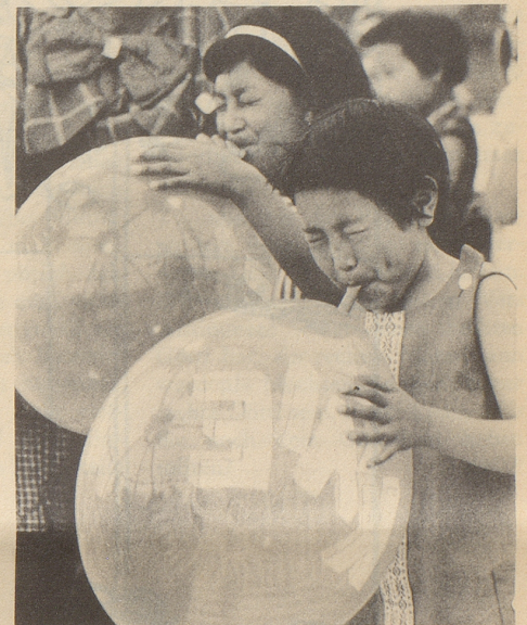
Beim Ballonblasen in der Manege spiegelt sich auf den bald einmal platzenden Kugeln das Zirkuszelt