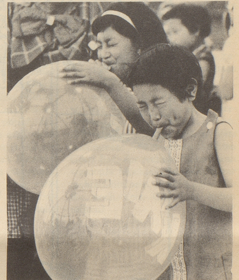
Beim Ballonblasen in der Manege spiegelt sich auf den bald einmal platzenden Kugeln das Zirkuszelt