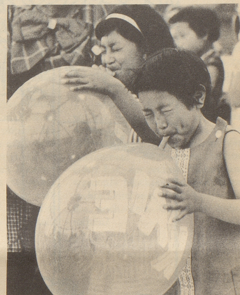
Beim Ballonblasen in der Manege spiegelt sich auf den bald einmal platzenden Kugeln das Zirkuszelt