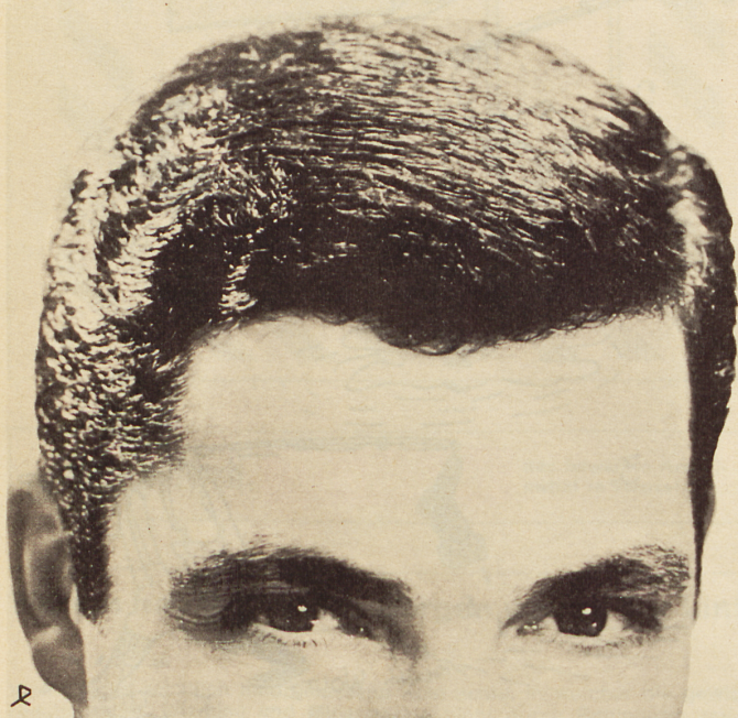
Parfumerie Franco-Suisse, Ewald & Cie. AG, Pratteln/Basel