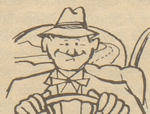
Herr Meier, der ein Auto lenkt, denkt, wenn er wirklich etwas denkt: Ich trinke FREMO, bleib' im Schwung und schone die Versicherung.

sind alte Schlager, die man immer noch summt, vielleicht weil sie netter im Ohr klingen als Hully-Gully, vielleicht einfach weil man durch sie an die eigene Jugend erinnert wird. Antiquitäten sind umso größere Mode, je skandinavischer sich unsere Möbel gebärden. Und zu antik und zu Teak gleich gut passen die herrlichen alten und neuen Orientteppiche von Vidal an der Bahnhofstraße 31 in Zürich.