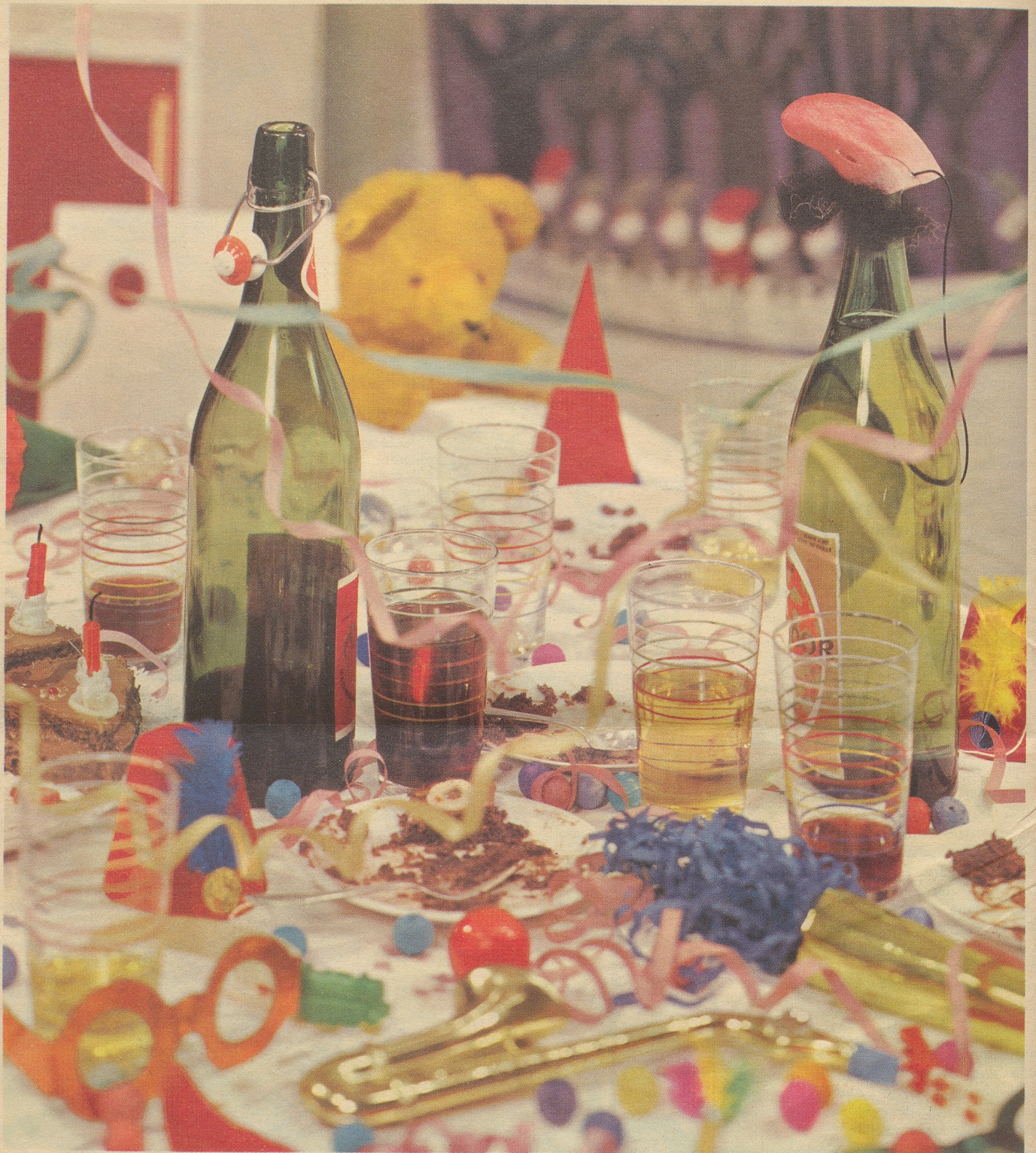
SPZ 64/5 Hans Gfeller BSR Zürich