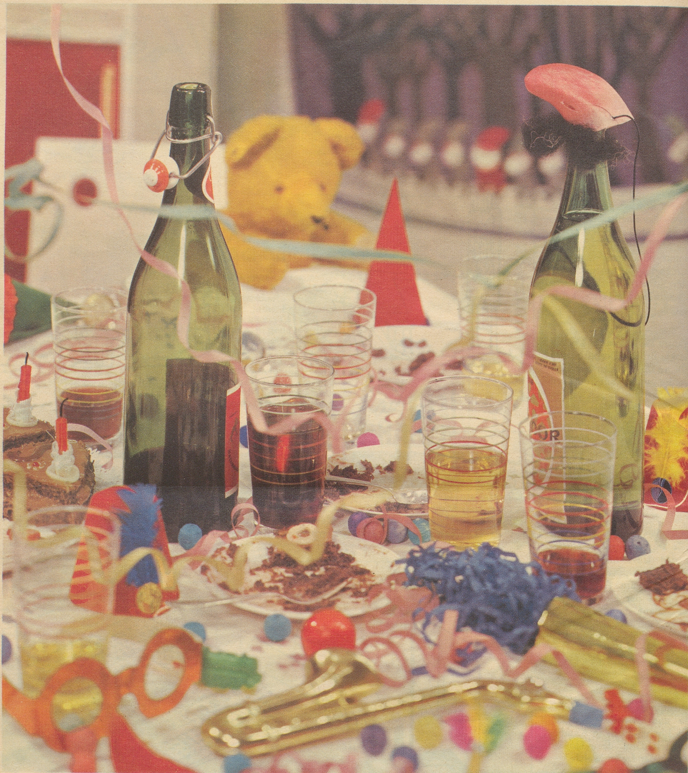
SPZ 64/5 Hans Gfeller BSR Zürich