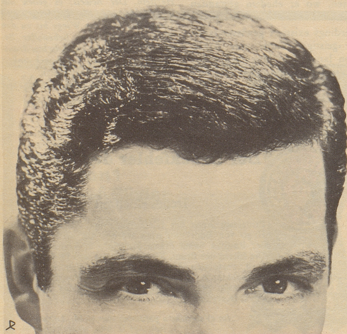
Parfumerie Franco-Suisse, Ewald & Cie. AG, Pratteln/Basel