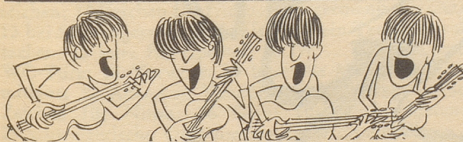
“The Beatles” kommen

Die Hamburger Illustrierte Stern hatte die gute Idee, den gewesenen Verteidigungsminister Strauß von einem 18jährigen Mittelschüler interviewen zu lassen. Strauß warnte den Jüngling unter anderen: «Heute werden bestimmte Machtpositionen der Presse zur Verbreitung von Unwahrheiten mißbraucht. Lassen Sie sich doch nichts aufschwätzen!» – Dem Presseorgan Stern gebührt für die Wiedergabe dieser Aeufßerung ein Sternchen! GP