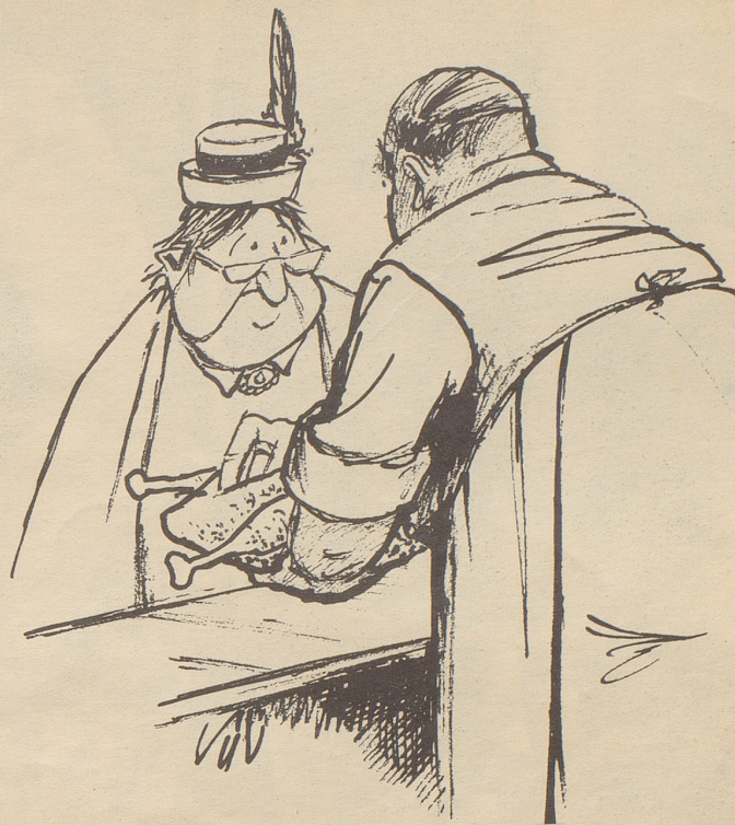
«Es ganz es prima Supp ehuhn, Frau Blööterli — schpeziell mit Bulionwürfel gfuetteret!»

Das Paar feiert in aller Rüstigkeit seine goldene Hochzeit, und auch der Reporter des Lokalblattes stellt sich ein. «Es ist also wahr, daß Sie mit neunzehn Dollar wöchentlich eine Familie mit fünf Kindern ernährt haben?» «Pst, nicht so laut», flüstert der alte Mann ängstlich. «Ich habe meiner Frau immer nur siebzehn Dollar fünfzig eingestanden.» Mitgeteilt von n. o. s.