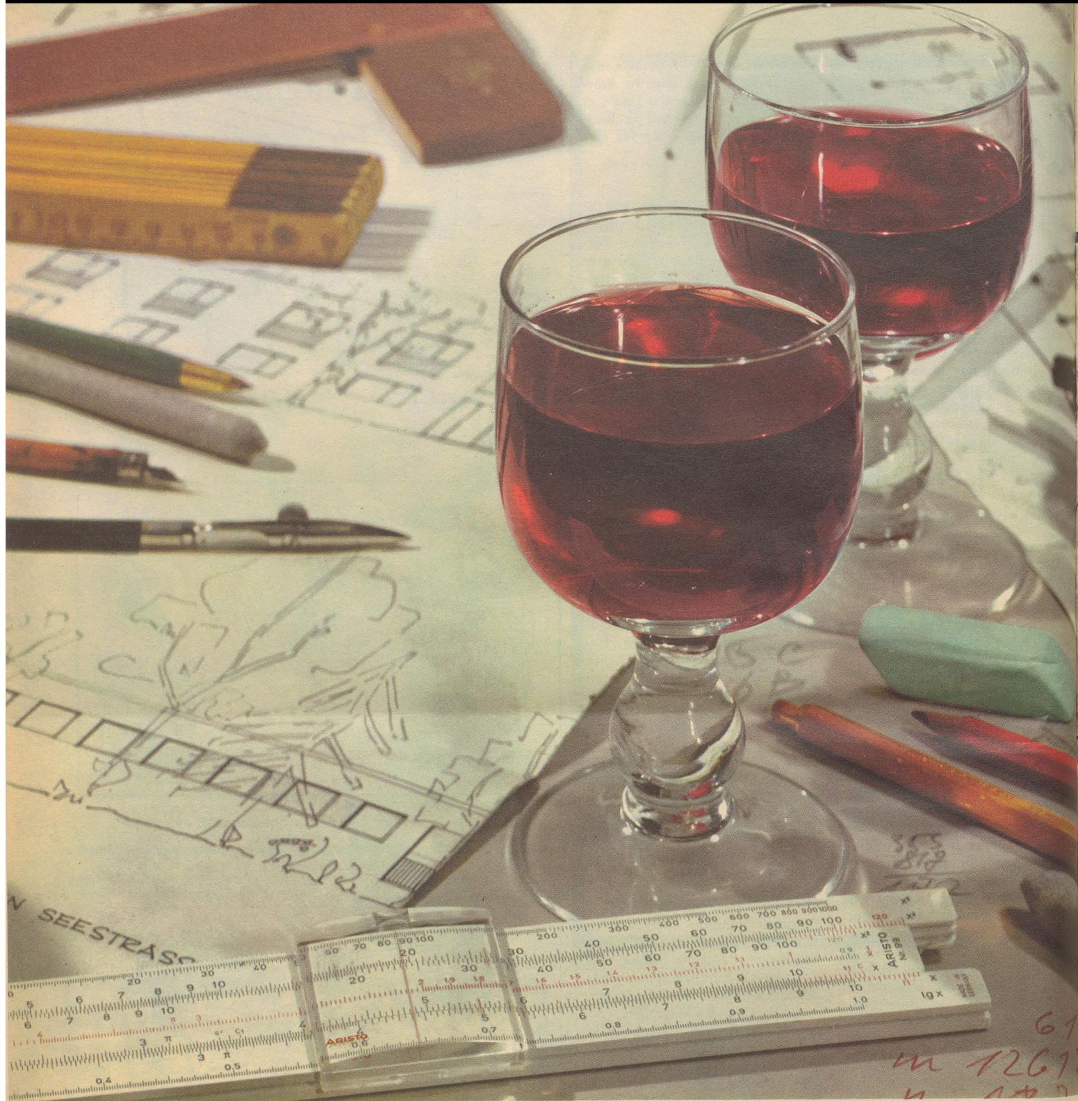
SPZ 64/4 Hans Gfeller BSR Zürich