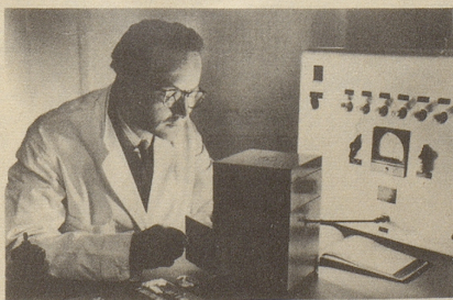
Wissenschaftlich bewiesen: Die Aufbaustoffe von Neo-Silvikrin gelangen bis in die Haarwurzeln!

Bestimmt haben auch Sie schon dies oder jenes unternommen, um den Haarausfall aufzuhalten... und das Ergebnis??? Jetzt endlich brauchen Sie nicht mehr den Mut zu verlieren, denn es gibt ja Neo-Silvikrin — die auf der ganzen Welt anerkannte biologische Haarnahrung! Die erste Voraussetzung für die Wirksamkeit eines Haarpräparates ist: Seine Wirkstoffe müssen bis in die Haarwurzeln gelangen!