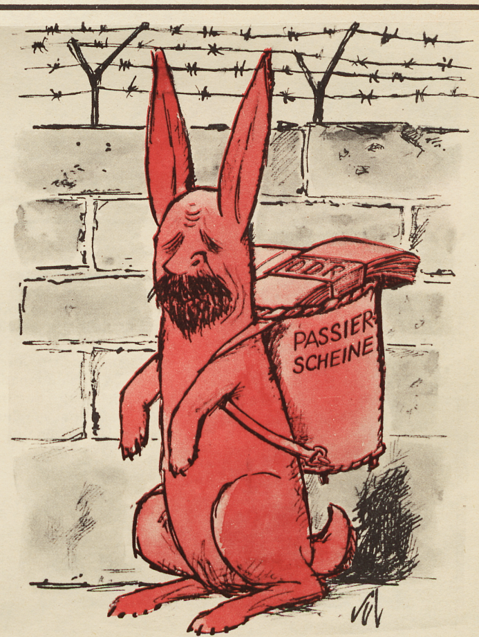
«Schade, das wär'n nu so scheene bolliddische Ostereier geworden — un so billig!»