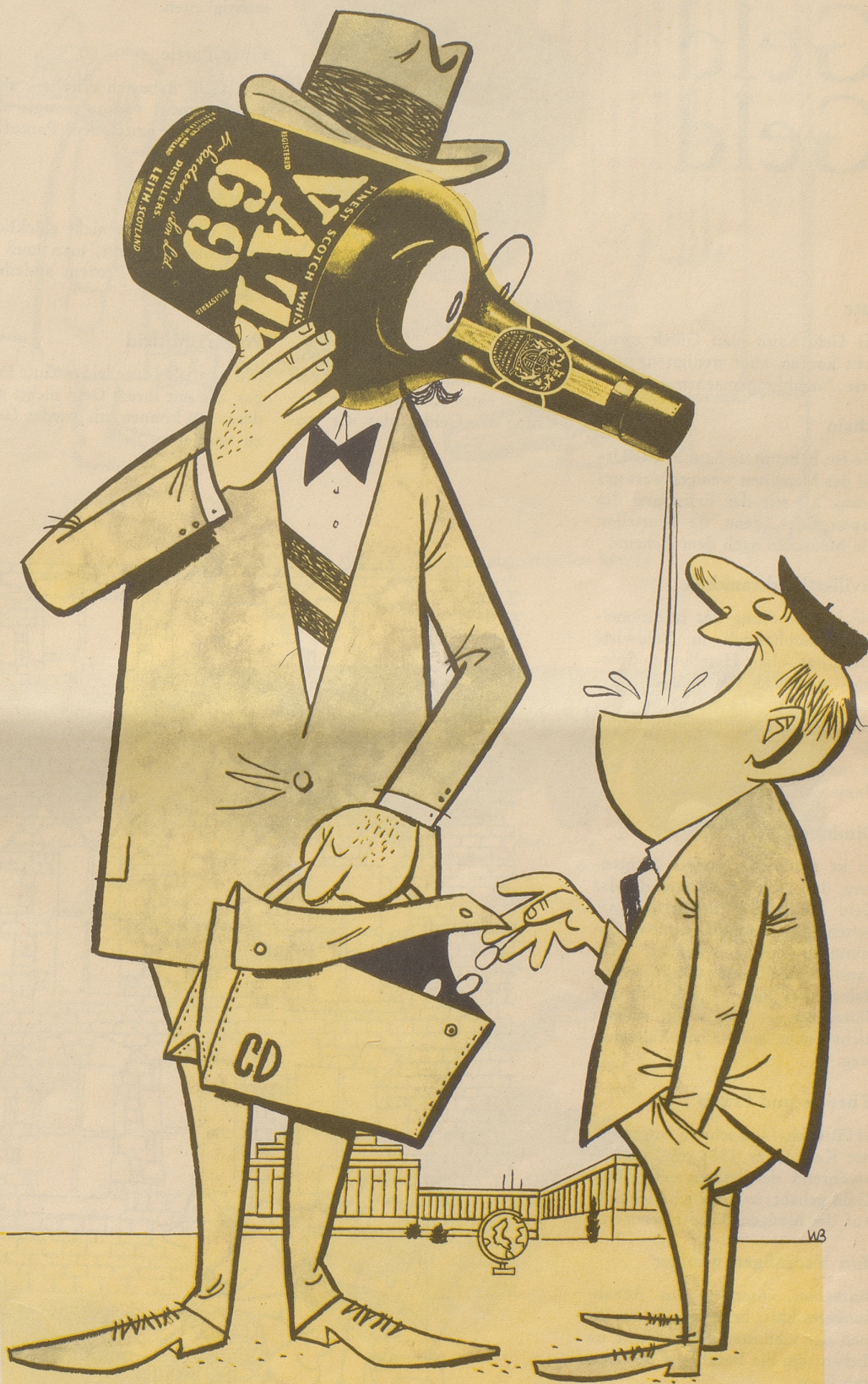
UNO-Beamte in Genf treiben schwunghaften Handel mit Whisky