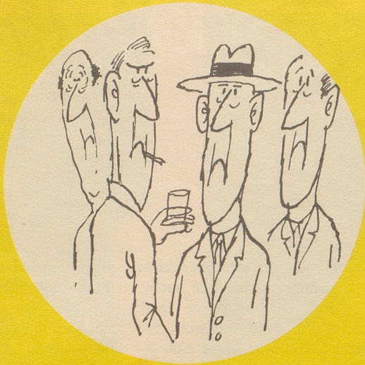
... herrschte im ganzen Land ob dieser Maßnahme eitel Freude.