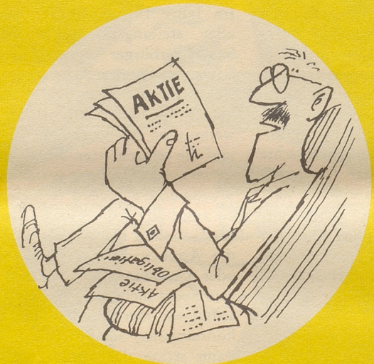
... und erinnerte sich wieder seiner Kulturgüter und las.