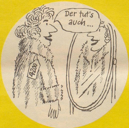
Man wurde bescheidener und bescheidener ...