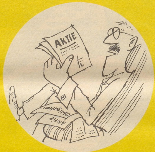
... und erinnerte sich wieder seiner Kulturgüter und las.