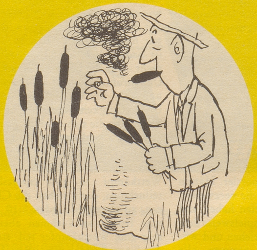
Geraucht wurde nur noch von wenigen – und auch hier fand man einen Weg, die Konjunktur zu stoppen ...