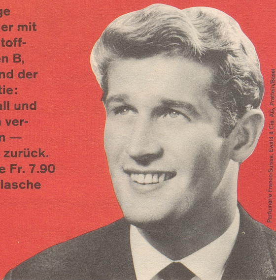
Parfumerie Franco-Suisse, Ewald & Cie, AG, Preiten/Basel

Das einzige Haarwasser mit den Wirkstoff- Komplexen B, F und H und der FS-Garantie: Haarausfall und Schuppen ver- schwinden — oder Geld zurück. Kurf Flasche Fr. 7.90 Standardflasche Fr. 5.90