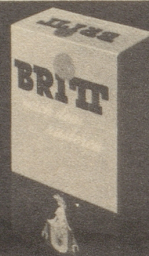
BRITT nach dem Rasieren