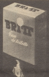
BRITT Eau de Toilette 80°

BRITT hair Lotion und BRITT hair Cream verhindern Schuppen und Haarausfall, schenken dem Haar einen natürlichen, anziehenden Glanz, erlauben ein leichtes Frisieren und machen die Frisur lange haltbar. BRITT bietet alles, was man von modernen Haarpflegemitteln erwarten kann.