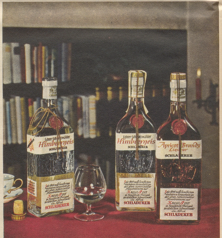
SCHLADERERS echter Schwarzwälder Himmbergeis und Apricot

Schon der Duft verbeisst höchsten Genuss — das vollkommene Aroma übertrifft Ihre Erwartungen!