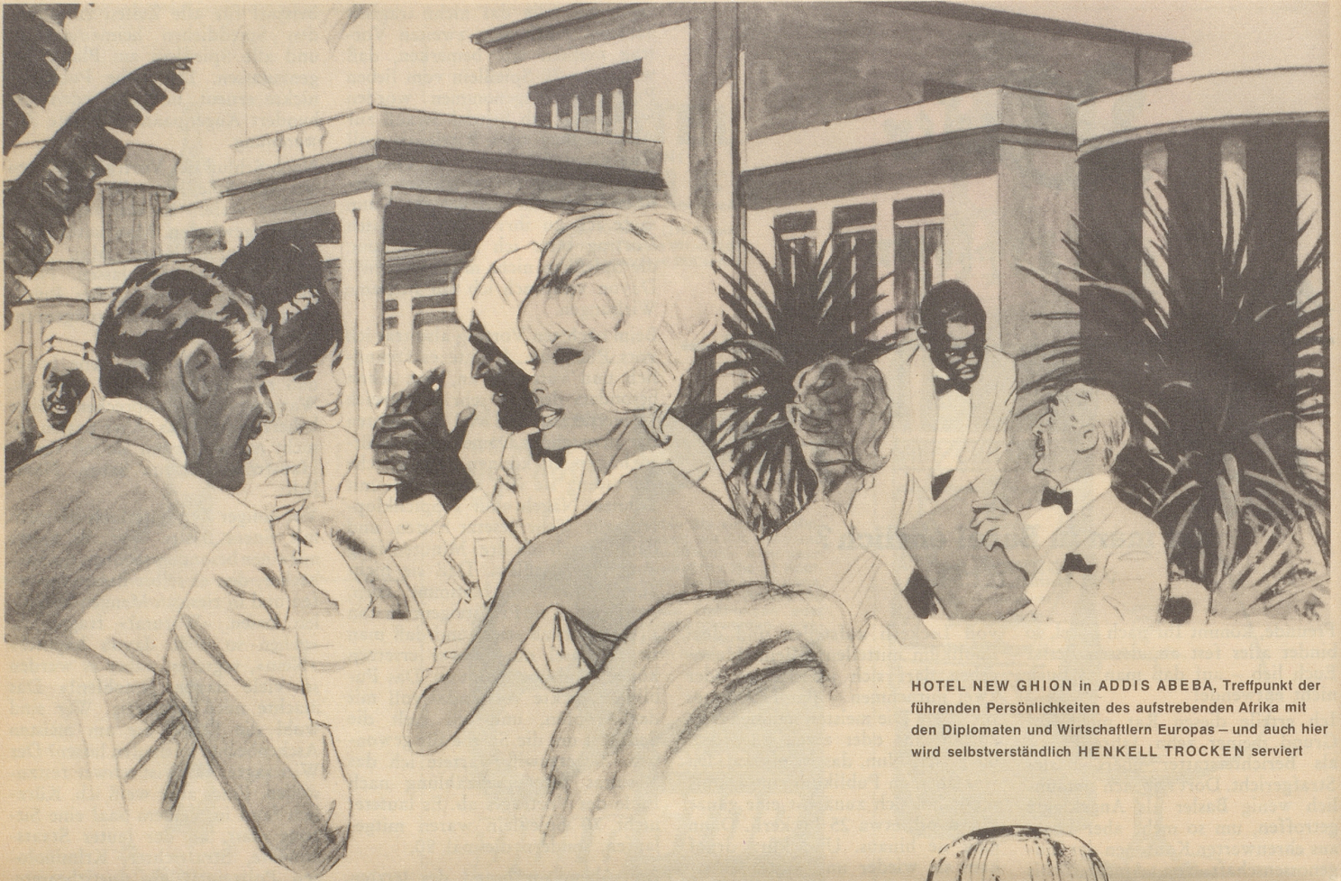
HOTEL NEW GHION in ADDIS ABEBA, Treffpunkt der führenden Persönlichkeiten des aufstrebenden Afrika mit den Diplomaten und Wirtschaftlern Europas – und auch hier wird selbstverständlich HENKELL TROCKEN serviert