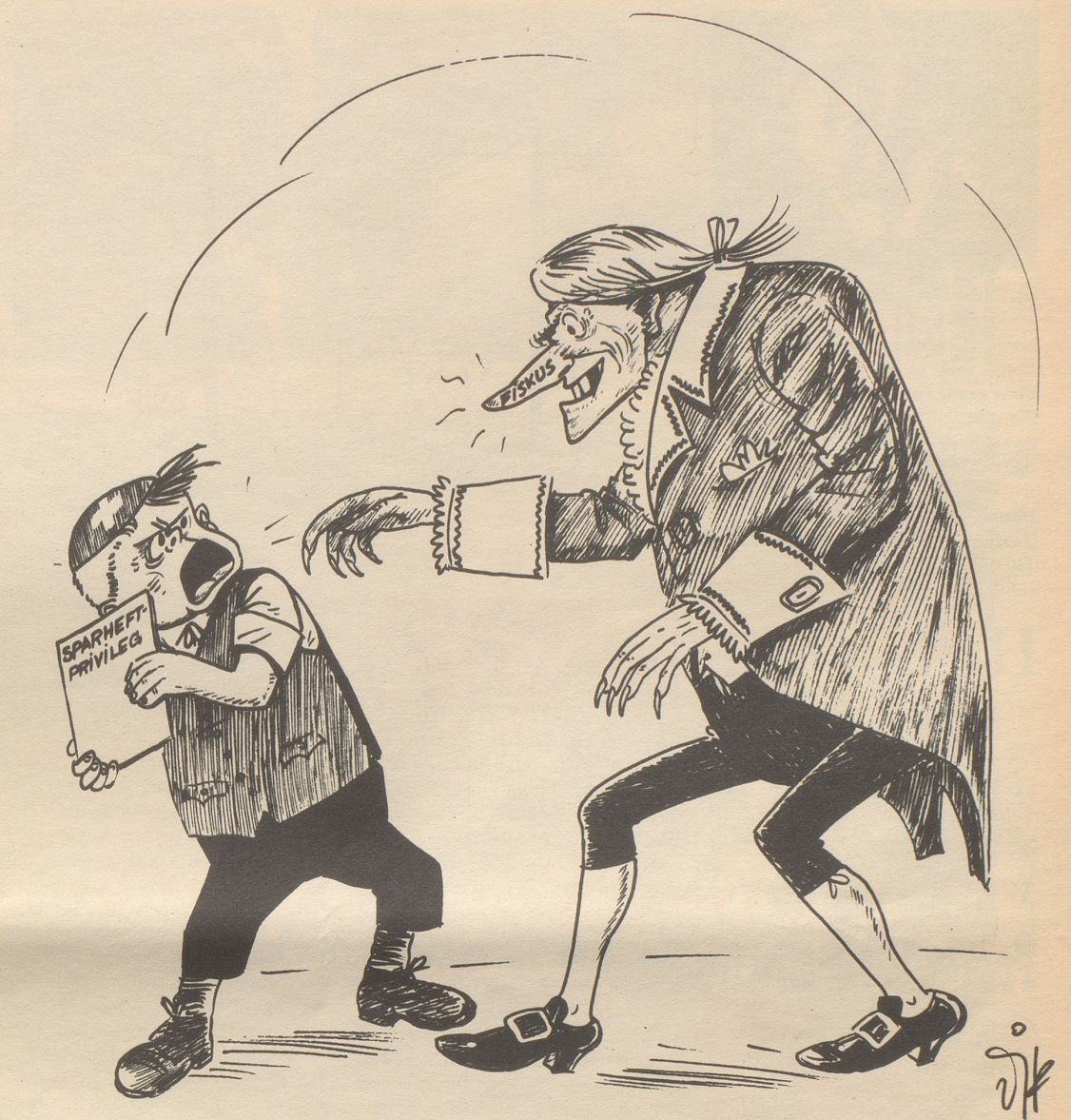
Das Sparheft-Privileg (Zinserträge von jährlich weniger als 40 Franken von Verrechnungssteuer befreit) soll aufgehoben werden.

Es braucht auch Bekennermut, vor die große Oeffentlichkeit zu treten und im ganzen Kanton herum zu verkünden: Ich bin ein Freisinniger («Einer von den Mehbesseren, der den Reichen höfelet!») oder ein Sozialdemokrat («Was? So ein Halbkommunist? Das hätte ich von dem doch nicht gedacht, sein Vater war doch ein rechter Mann!») oder ein Konservativer («Der meint wahrscheinlich, er werde dann einmal heiliggesprochen, wenn er den