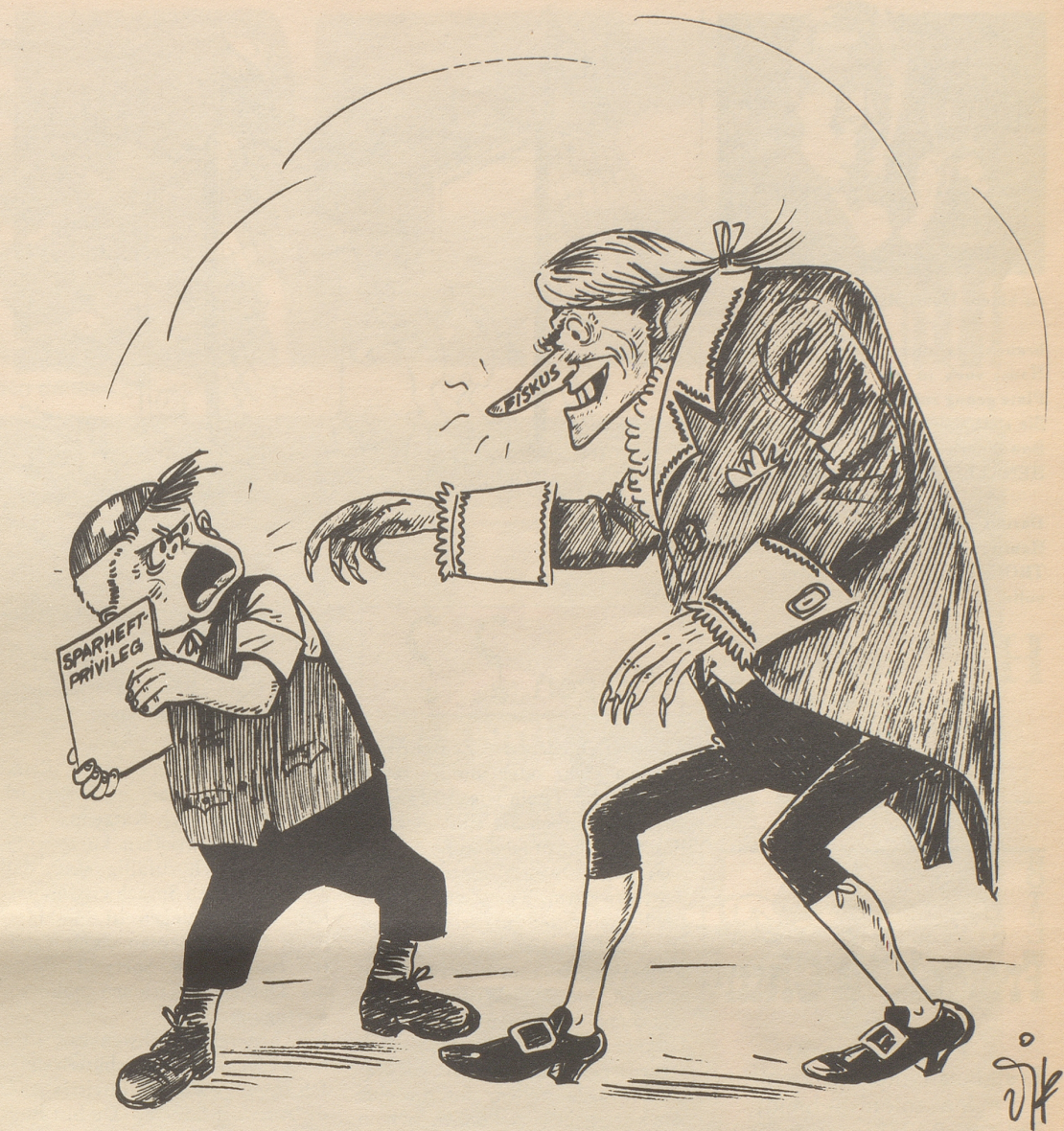
Das Sparheft-Privileg (Zinserträge von jährlich weniger als 40 Franken von Verrechnungssteuer befreit) soll aufgehoben werden.

Es braucht auch Bekennermut, vor die große Oeffentlichkeit zu treten und im ganzen Kanton herum zu verkünden: Ich bin ein Freisinniger («Einer von den Mehnbesseren, der den Reichen höfelet!») oder ein Sozialdemokrat («Was? So ein Halbkommunist? Das hätte ich von dem doch nicht gedacht, sein Vater war doch ein rechter Mann!») oder ein Konservativer («Der meint wahrscheinlich, er werde dann einmal heiliggesprochen, wenn er den