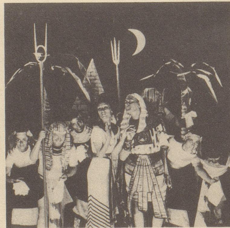
Und es gab genug Kleenex in einer einzigen Schachtel für alle 100 Schauspieler.