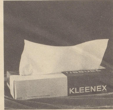
Doch glücklicherweise – hopp – hüpfte Kleenex auf die Bühne, – frisch, weiss und blütenrein.