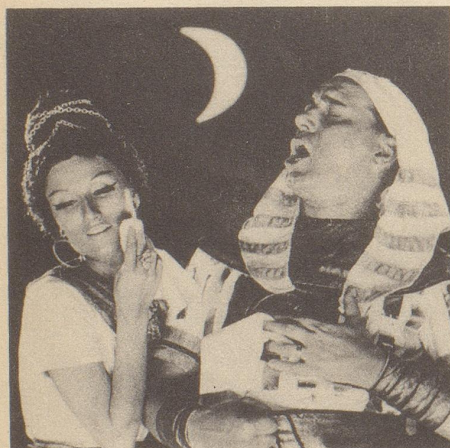
Kleenex – weich genug für eine Primadonna. Und stark genug für den Heldenenor.