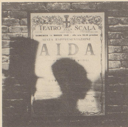
Festliche Premiere in der Oper.