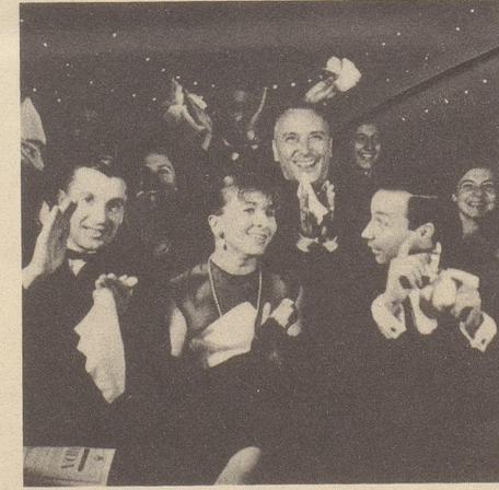
Mit Kleenex ist jeder glücklich und zufrieden!

Und hopp! KLEENEX auch für Sie... weich (für die empfindliche Nase), stark (für den grössten Schnupfen) und - natürlich - blütenrein (denn jedes KLEENEX ist nigelnagelneu).