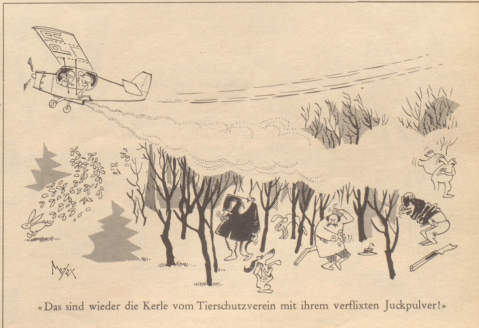
«Das sind wieder die Kerle vom Tierschutzverein mit ihrem verflixten Juckpulver!»

Senkrecht: 1 Divico, 2 Gaebris, 3 Iris, 4 Lein, 5 la, 6 a D, 7 Erstling, 8 Gau, 9 le, 10 Ei, 11 Evi, 12 Trub, 13 Ap, 14 Eibe, 15 Laus, 16 UNO, 17 Warte, 18 ue, 19 Neon, 20 AG, 21 an, 22 Nidder, 23 VI, 24 Hehl, 25 Etter, 26 Klee, 27 RN, 28 ie, 29 Eureka, 30 RM, 31 Esten, 32 Rn, 33 Cent, 34 Unst, 35 Gehr, 36 Gnu, 37 Hg, 38 Ort, 39 Stab, 40 Ur, 41 Liedrian, 42 Emu, 43 Ne, 44 Erna, 45 Fluh, 46 in, 47 Fr, 48 Undset, 49 Traktat.