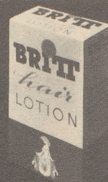
BRITT hair Lotion