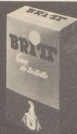
BRITT Eau de Toilette 80°