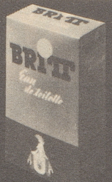
BRITT Eau de Toilette 80°