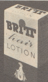
BRITT hair Lotion