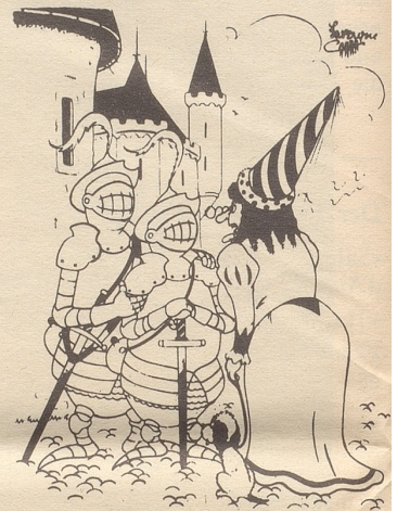
«Frau Gräfin, dies ist mein Sohn.» «Ei, welche Ähnlichkeit!»

700 000 zusätzliche Kilowatt wurden in der Nacht auf Mittwoch, 25. September, konsumiert, während welcher die Engländer den Denning-Report verschlangen. Das will aber nicht heißen, daß dadurch mehr Licht in diese Affäre gekommen sei.