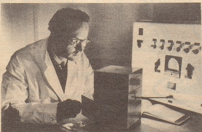
Wissenschaftlich bewiesen: Die Aufbaustoffe von Neo-Silvikrin gelangen bis in die Haarwurzeln!

Bestimmt haben auch Sie schon dies oder jenes unternommen, um den Haarausfall aufzuhalten... und das Ergebnis??? Jetzt endlich brauchen Sie nicht mehr den Mut zu verlieren, denn es gibt ja Neo-Silvikrin — die auf der ganzen Welt anerkannte biologische Haarnahrung! Die erste Voraussetzung für die Wirksamkeit eines Haarpräparates ist: Seine Wirkstoffe müssen bis in die Haarwurzeln gelangen!