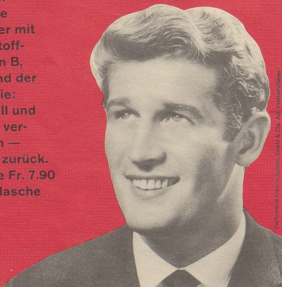
Parfumerie Franco-Suisse, Ewald & Cie. AG, Pratteln/Basel

FS-Brennessel-petrol-Konzentrat - ein Spitzenprodukt vom Fachmann empfohlen! Das einzige Haarwasser mit den Wirkstoff-Komplexen B, F und H und der FS-Garantie: Haarausfall und Schuppen verschwinden — oder Geld zurück. Kurflasche Fr. 7.90 Standardflasche Fr. 5.90