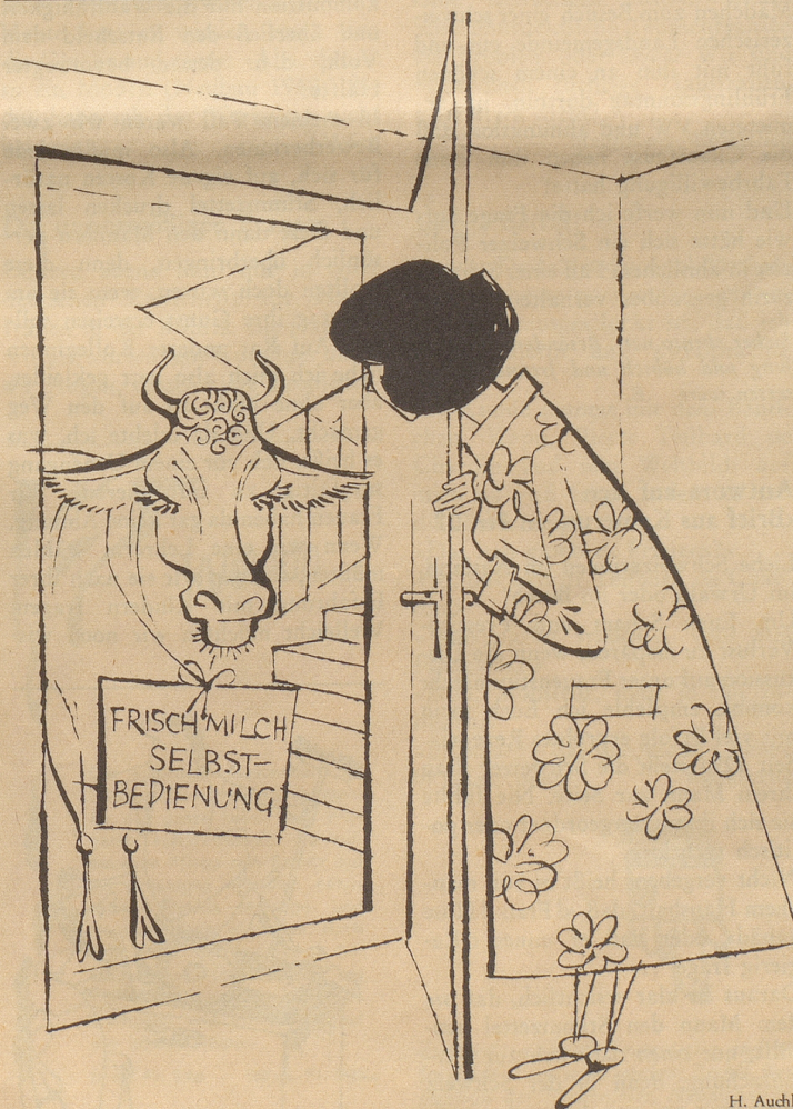
Hauszustellung der Milch in Frage gestellt