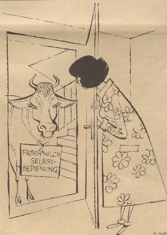
Hauszustellung der Milch in Frage gestellt