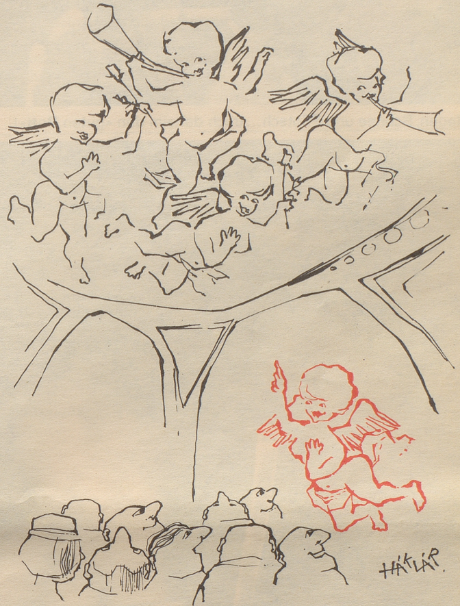
Stilgemäße Fremdenführung in Wien