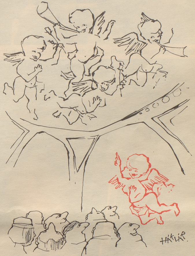
Stilgemäße Fremdenführung in Wien