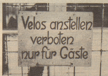
Dieses seltsame Plakat sah ich am Hause einer Confiserie in St. Moritz. E. St., Basel