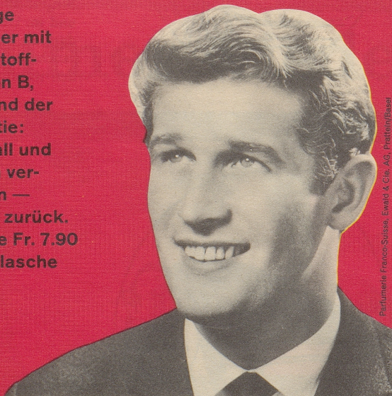
Parfümerie Franco-Suisse, Ewald & Cie. AG, Brackwiler/Basel

FS-Brennessel-petrol-Konzentrat - ein Spitzenprodukt vom Fachmann empfohlen! Das einzige Haarwasser mit den Wirkstoff-Komplexen B, F und H und der FS-Garantie: Haarausfall und Schuppen verschwinden — oder Geld zurück. Kurflasche Fr. 7.90 Standardflasche Fr. 5.90