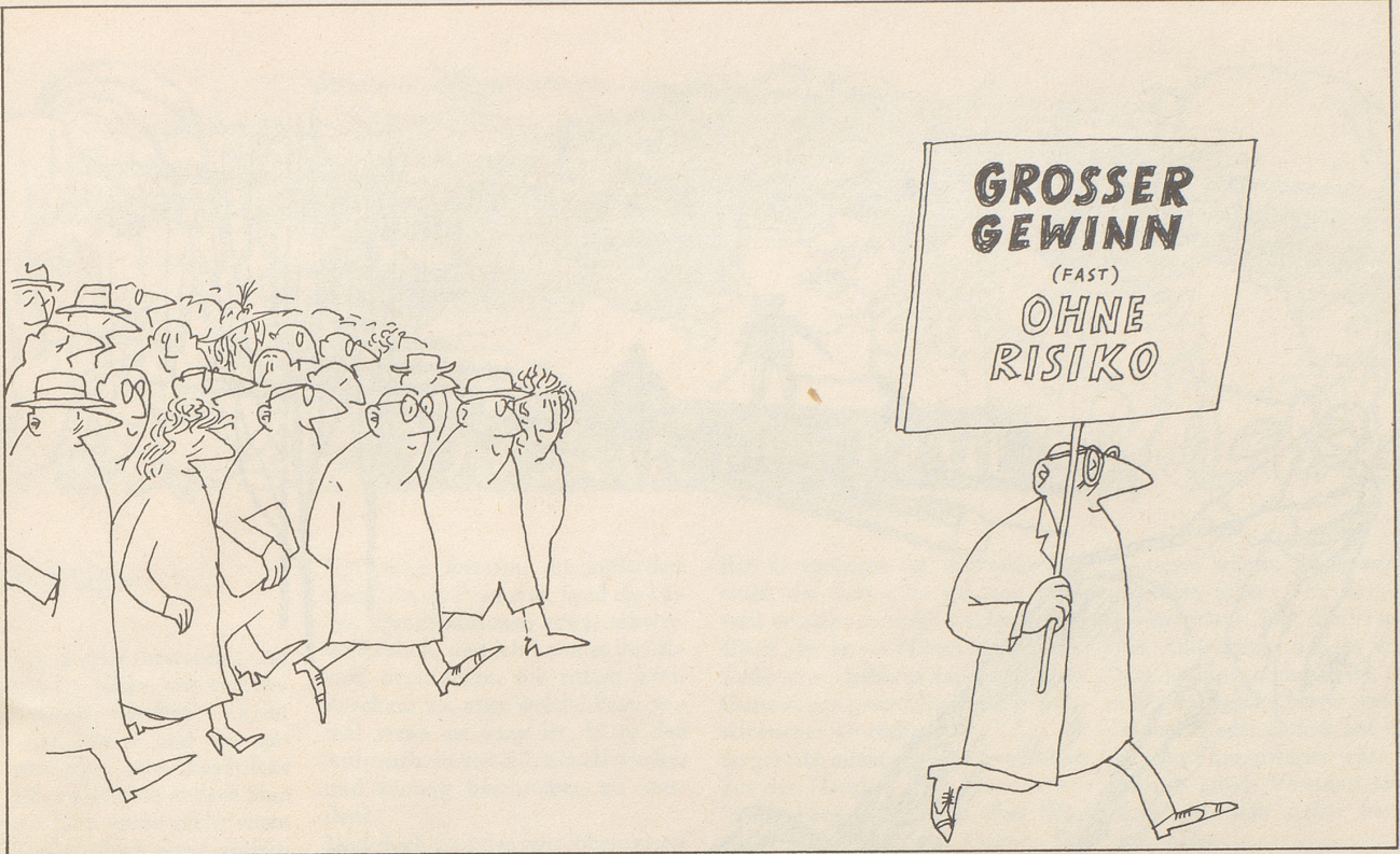
Gar mancher sucht im Geld sein Heil . . .