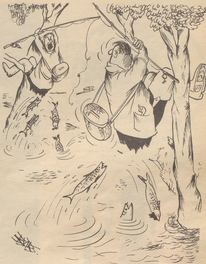
«Und das schlimmste daran ist, daß uns das am Stammtisch niemand glauben wird!»