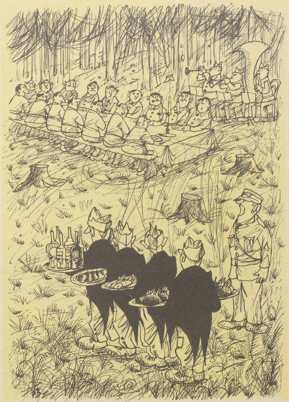
Die Verordnung, daß unsere Militärkost nun verfeinert werden soll, läßt eine willkommene Entwicklung im Verpflegungswesen ahnen.

im Bauch der Patientin vergessen. Das Röntgenbild macht zurzeit die Runde durch den westlichen Presse-fh