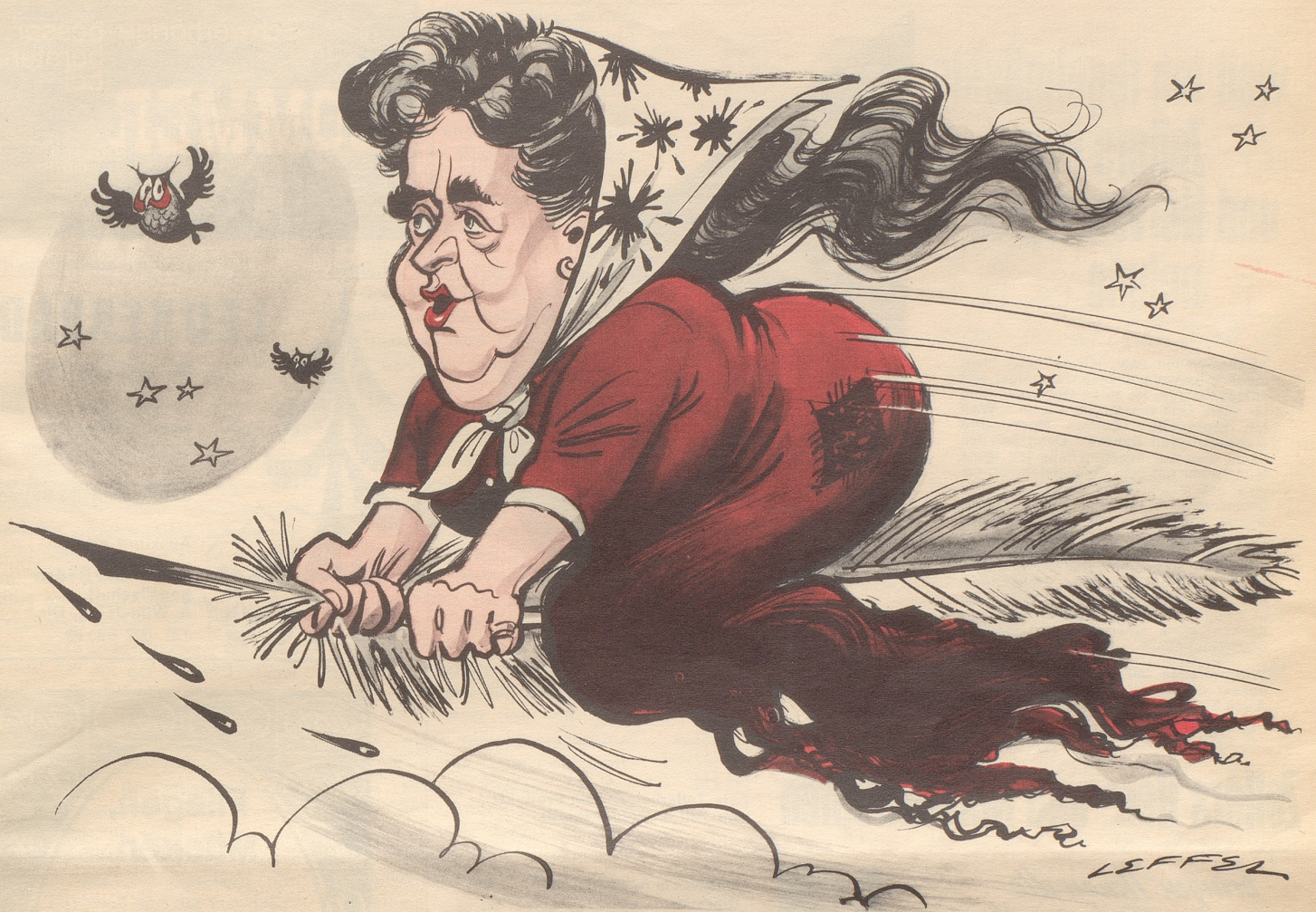
Elsa Maxwell, internationale Super-Klatschbase, 80 jährig . . .