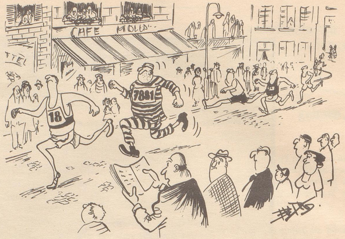
«Diese Nummer 7881 finde ich nicht auf der Startliste ...»

Nur stellt sich am Schluß noch eine Preisfrage: Sind unsere Wahlergebnisse damit wirkungsvoll abgesichert gegen den Einfluß egoistisch-wirtschaftlicher Ueberlegungen? Daran wagt nicht ganz zu glauben Dr. med. Politicus