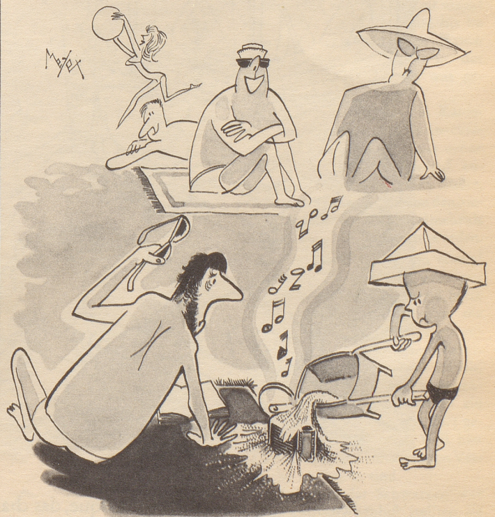
«Si müend entschuldige — er hät drum de Tschäss nöd gern!»