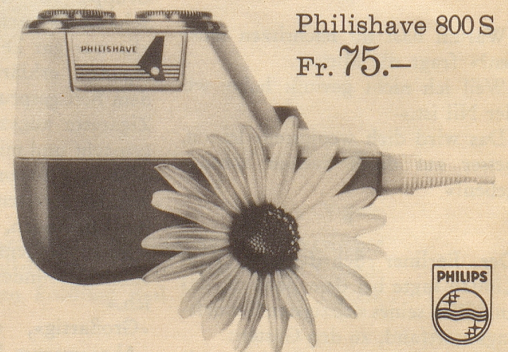
Philishave 800 S Fr. 75.-

Weitere Modelle: Philishave 120 Special Fr. 52.- / Batterie-Philishave Fr. 49.- Haarschneide-Garnitur zu Philishave 800 S Fr. 18.-