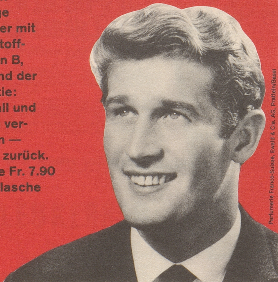
Parfumerie Franco-Suisse, Ewald & Cie. AG, Pratteln/Basel

FS-Brennessel-petrol-Konzentrat - ein Spitzenprodukt vom Fachmann empfohlen! Das einzige Haarwasser mit den Wirkstoff-Komplexen B, F und H und der FS-Garantie: Haarausfall und Schuppen verschwinden — oder Geld zurück. Kurflasche Fr. 7.90 Standardflasche Fr. 5.90