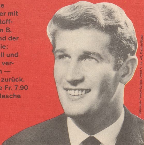
Parfumerie Franco-Suisse, Ewald & Cie. AG, Pratteln/Basel

Das einzige Haarwasser mit den Wirkstoff- Komplexen B, F und H und der FS-Garantie: Haarausfall und Schuppen ver- schwinden — oder Geld zurück. Kurf Flasche Fr. 7.90 Standardflasche Fr. 5.90