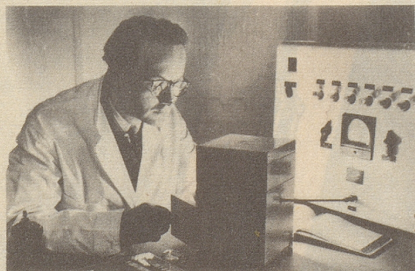
Wissenschaftlich bewiesen: Die Aufbau- stoffe von Neo-Silvikrin gelangen bis in die Haarwurzeln!

Bestimmt haben auch Sie schon dies oder jenes unternommen, um den Haarausfall aufzuhalten... und das Ergebnis??? Jetzt endlich brauchen Sie nicht mehr den Mut zu verlieren, denn es gibt ja Neo-Silvikrin — die auf der ganzen Welt anerkannte biologische Haarnahrung! Die erste Voraussetzung für die Wirksamkeit eines Haarpräparates ist: Seine Wirkstoffe müssen bis in die Haarwurzeln gelangen!