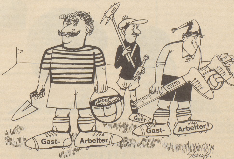
Invasion im Schweizer Fußball