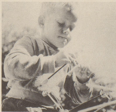
Das Spiel lehrt ihn konstruktives und präzises Arbeiten. Täglich Ovomaltine schafft die Voraussetzung dazu.