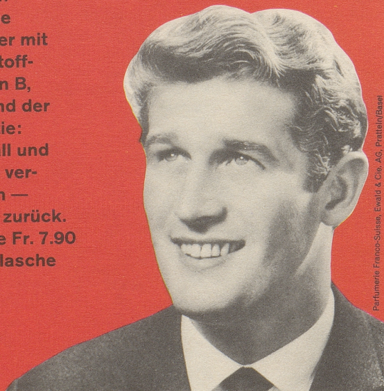
Parfumerie Franco-Suisse, Ewald & Cie. AG, Pratteln/Basel

Das einzige Haarwasser mit den Wirkstoff- Komplexen B, F und H und der FS-Garantie: Haarausfall und Schuppen ver- schwinden — oder Geld zurück. Kurflasche Fr. 7.90 Standardflasche Fr. 5.90